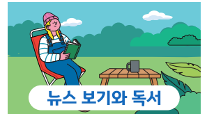
뉴스 보기와 독서

가까운 야구장을 찾거나 바다를 보러 가고, 영화를 관람하는 것처럼 일상의 나들이를 통해 경험의 기회를 늘려봐요.